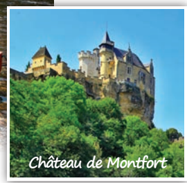
Château de Montfort