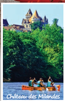
Château des Milandes