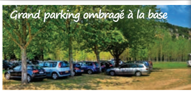
Grand parking ombragé à la base

Arrivée aux MILANDES dans le parc de Joséphine Baker