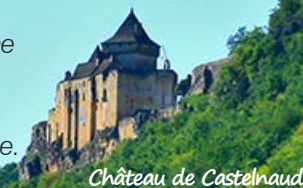
Château de Castelnaud

The location is 1 km upstream at the village of «La Roque-Gageac» on the right bank of the Dordogne. We welcome you to discover this beautiful river from this special place.